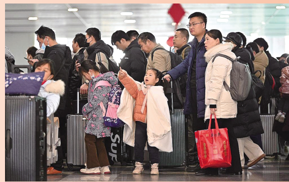
2月3日,家长带领小朋友在北京丰台站排队检票。

针对公众关注的春运火车票购票相关问题,记者进行了采访调查,12306也作出回应。