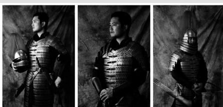
杨家湾西汉兵马俑甲冑复原图