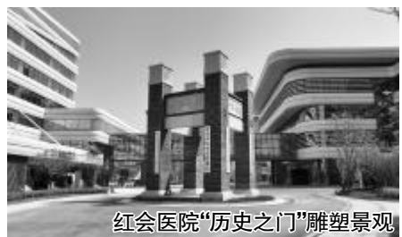
红会医院“历史之门”雕塑景观

占地314亩,总投资58亿元,建筑面积达68万平方米,总床位3408张、手术室136间,门诊日接诊能力可达2万人次,年手术量超过11万例……西安市红会医院北院区地处西安北站和西安咸阳国际机场交通枢纽核心区,区位优势明显,服务可延展性强。院区采用“H立方”总体设计理念,将“一带一路”的大国复兴之轴、千年西安的古都文脉之轴、渭河沿岸的生态景观之轴、百年红会的品牌建设