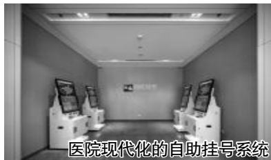
医院现代化的自助挂号系统