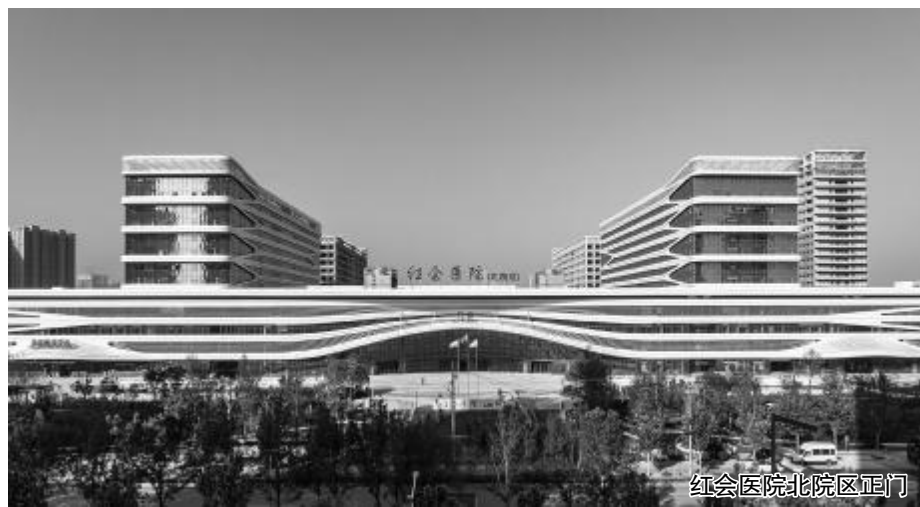
红会医院北院区正门

影像诊疗中心、放射科、术中影像科、磁共振室、CT室、B超一室、B超二室、检验科、输血科、病理科、药剂科、临床药学科、临床药物试验办公室(GCP)、功能检查科、转化医学中心、消毒供应中心、大数据管理中心、保健科等医技科室,也紧跟新技术新理念业务发展方向,不断提升服务能力。