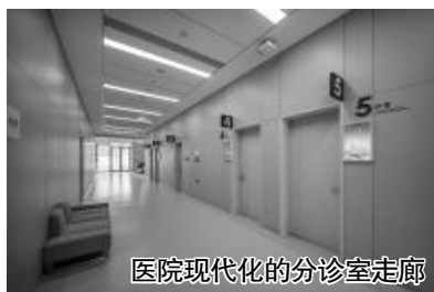
医院现代化的分诊室走廊