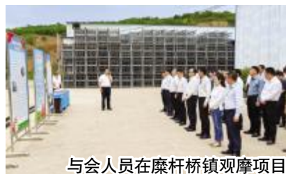
与会人员在糜杆桥镇观摩项目

一直以来,农行宝鸡分行高度重视防范电信网络诈骗宣传工作,通过引导辖属各支行网点开展员工培训等方式,切实把好银行“第一道关口”,用实际行动保障群众的合法权益。