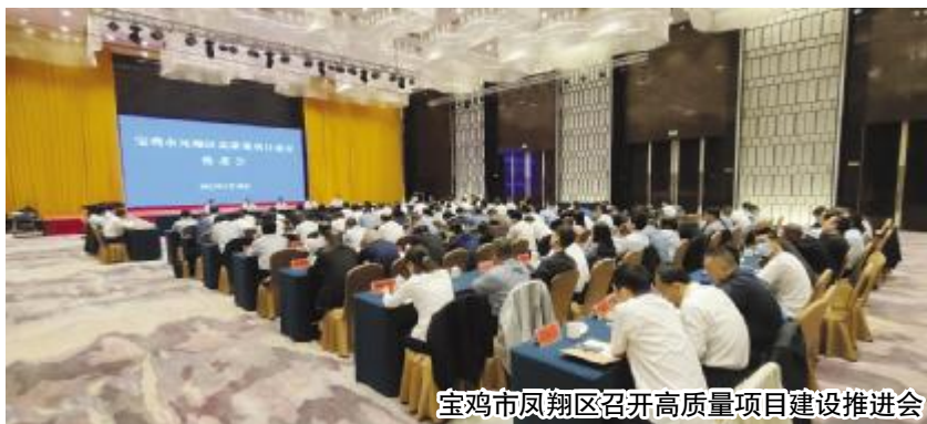
宝鸡市凤翔区召开高质量项目建设推进会

总投资733.14亿元,年度投资191.91亿元的340个重点建设项目,至4月底已开(复)工284个,开工率83.5%,完成投资86.55亿元,占年度投资45.1%。