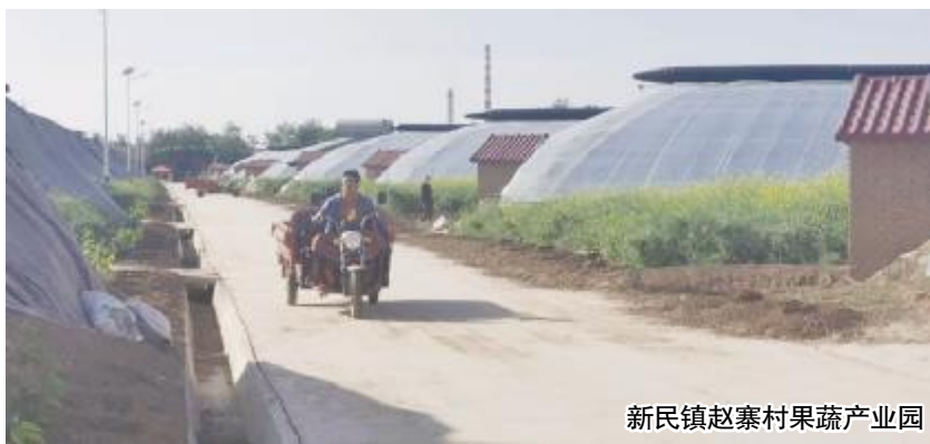
新民镇赵寨村果蔬产业园

休闲观光农业，将果蔬采摘、农家乐融合在一起，吸引了大量游客前来参观、体验。这不仅为当地农民增加了收入，也促进了乡村旅游发展。