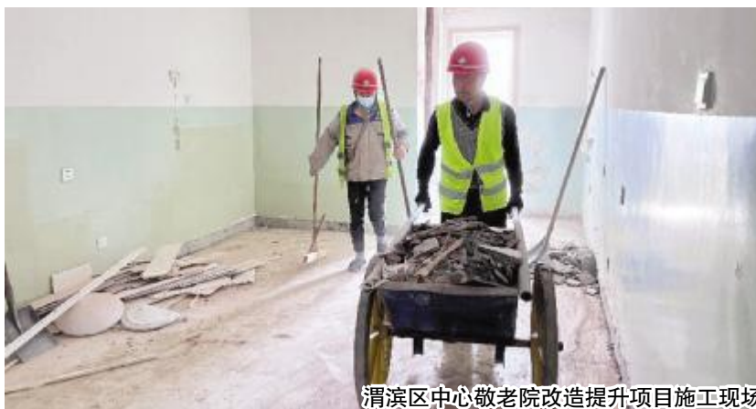
渭滨区中心敬老院改造提升项目施工现场

“敬老院一楼设置的可视化数据展示大屏，可实时监测老人的活动轨迹、健康状态等情况，也可及时反映护理人员的服务质量、中央厨房的卫生