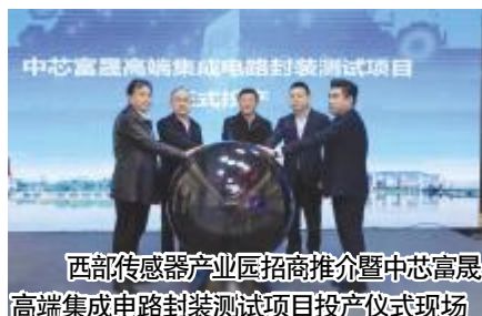
西部传感器产业园招商推介暨中芯富晟高端集成电路封装测试项目投产仪式现场

成绩斐然信心,重任激励前行,2023年,渭滨区以开局就是决战,起跑就是冲刺的势头,牢固树立“项目为王”意识,紧盯国家政策方向、投资导向、资金投向,不断做大做实全区项目盘子和资金盘子,突出固定资产投资、中省专项资金拨付支出进度等关键环节,全力解决好项目建设中土地、资金等要素保障问题,严格按照“四个一批”要求,建立健全重点项目专班推进机制,真正做到一切围着项目转、一切围着项目干,用高质量项目推动渭滨区工业高质量发展。