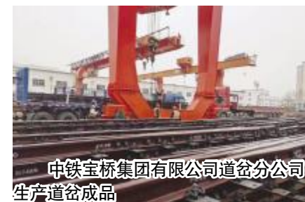
中铁宝桥集团有限公司道岔分公司生产道岔成品

产业转型是实现高质量发展的必由之路。渭滨区聚焦传统六大主导产业优势,大力实施工业企业装备智能升级、生产技术改造、产品换代更新、产业链条延伸“四大工程”,全力推动传统产业转型升级、高质量发展。2022年,全区共实施工业技改项目52个,总投资60亿元,项目全部建成达产后可新增产能80亿元,全区工业技改投资增速达到120%,工业企业智能化加工水平明显提升。长美科技