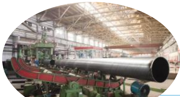
宝鸡钢管保供国内重大管线项目生产现场

春风送暖,草木萌发,渭滨大地处处跳动着工业发展的强劲脉搏。2023年宝鸡市渭滨区全力推动工业提质增效、规模扩大、创新突破,计划实施工业技改项目61个,新增产能40亿元。1月至2月,全区202户规模以上工业企业累计完成工业总产值103亿元,同比增长5.67%,计划和效益共同勾勒出全区工业经济高质量发展的立体图景,展示了渭滨工业经济高质量发展的韧性和活力。