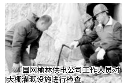
国网榆林供电公司工作人员对大棚灌溉设施进行检查。

1999年,高家渠村决定依靠川地土地平坦、水源充足的优势,以发展农村特色农业产业为方向,推进大棚种植计划。大棚种植浇水灌溉、照明、卷帘机都离不开电,为满足村上农业发展用电需求,国网榆林供电公司坚持