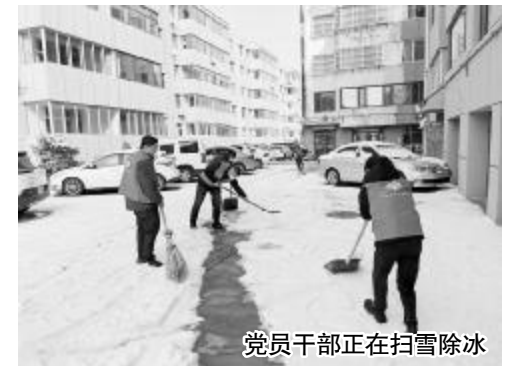
党员干部正在扫雪除冰

阳光讯2023年的第一场雪如约而至。2月9日,榆林福彩党员干部在创文包保阳光小区内积极开展扫雪除冰志愿服务活动,为群众清扫出安全出行的“绿色通道”。