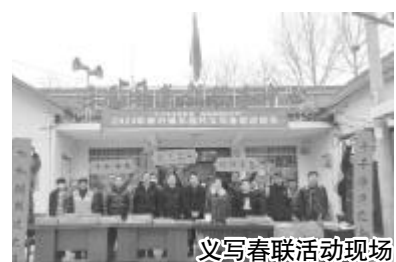
义写春联活动现场

活动现场翰墨飘香,暖意融融,红色纸张慢慢铺开,书法老师们挥毫泼墨,笔走龙蛇,行书、楷书、隶书等多种字体各显神韵,将美好的祝愿化作一副副充满喜庆、寓意吉祥的春联赠送给群众,来领取春联的群众络绎不绝,对着手中的春联连连称赞,喜悦之情