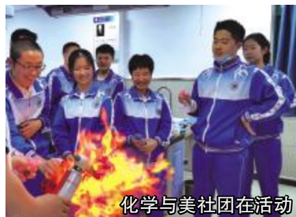
化学与美社团在活动

及各学科奖学金多种奖项,以鼓励在学习、各类竞赛、文体等方面成绩突出的学生。中考成绩连续数名列市、区前列,教育教学质量被社会各界认可。