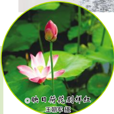
◎映日荷花别样红