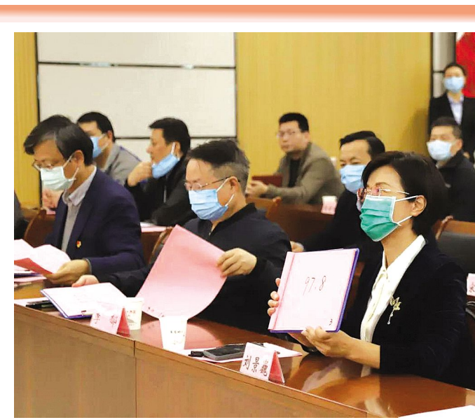
评委为参赛选手打分