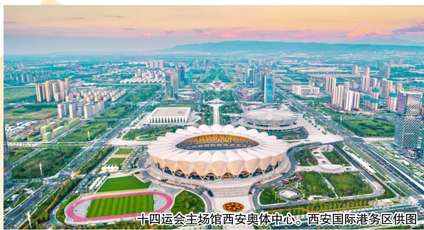
十四运会主场馆西安奥体中心。

本次办赛还将实现“零碳全运”。陕西全省41家新能源发电企业与59家赛事场馆达成“绿电”交易,成交电量1.38亿千